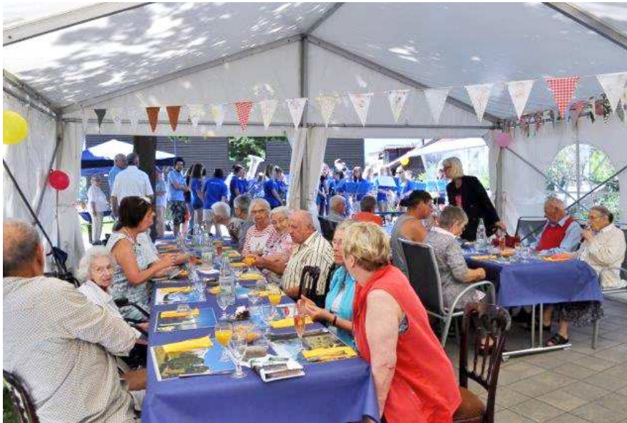
Das Sunnsyta Sommerfest ist ein beliebter Traditionsanlass.