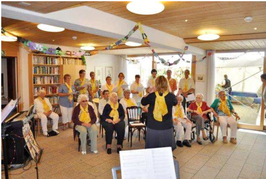
Der Sunnsyta Chor feierte am Sommerfest sein Comeback.

Das 30-jährige Bestehen des Altersheims Sunnsyta Ringgenberg wurde mit einem Sommerfest gefeiert. Trotz Sparmassnahmen des Kantons, blickt man im Jubiläumsjahr auf eine gesunde Finanzlage.