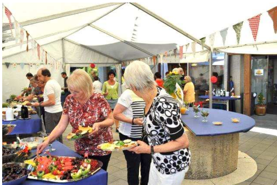
Auf die Besucher wartete ein reichhaltiges Mittagsbuffet.